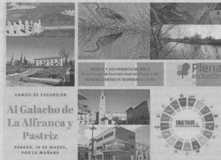
►► Cartel anunciador de la excursión a La Alfranca.

Naciones Unidas es una organización en la que se reúnen los gobiernos de todos los países del mundo.