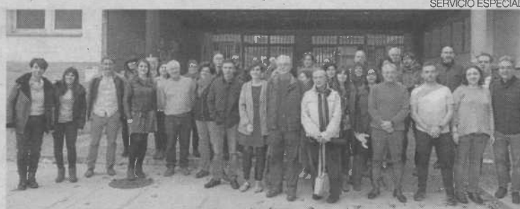
▶▶ Participantes en la primera mesa redonda del Espacio Educativo Hispanidad-Pignatelli.

El Espacio Educativo Hispanidad-Pignatelli ofrece una respuesta cercana y de proximidad, enmarcada en el ámbito de la enseñanza pública, desde la infancia hasta la edad adulta. De hecho, creciendo en y con tu entorno es otro de sus lemas porque, como aseguran los responsables de es-