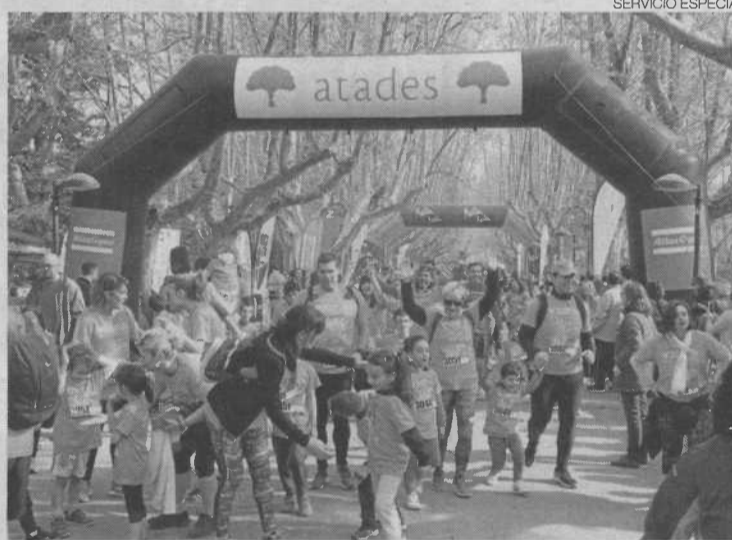
►► Participantes de la carrera celebrada el año pasado.

En la carrera pueden participar personas de todas las edades con y sin discapacidad. No hace falta ser un gran deportista, lo importante es tener un corazón solidario y muchas ganas de ayudar y divertirse. La prueba cuenta con la colaboración de numerosas